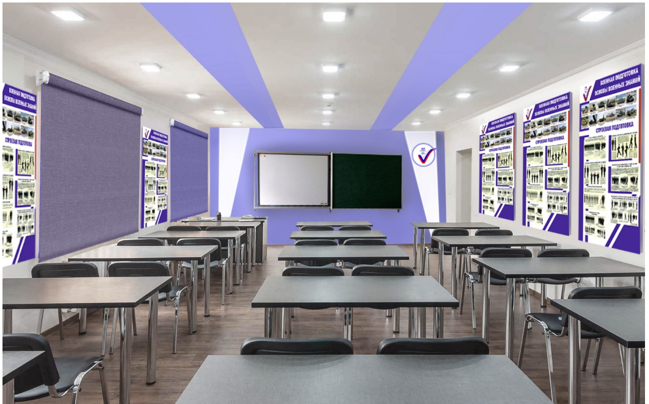
Дизайн-макет.1 – Вид на доску