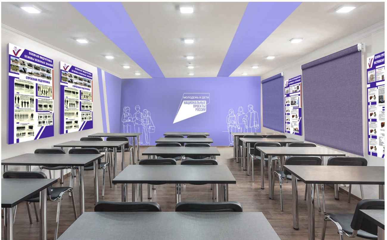
Дизайн-макет.2 – Вид на стену