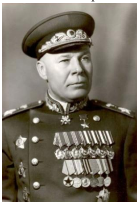
Маршал Советского Союза Семён Константинович Тимошенко